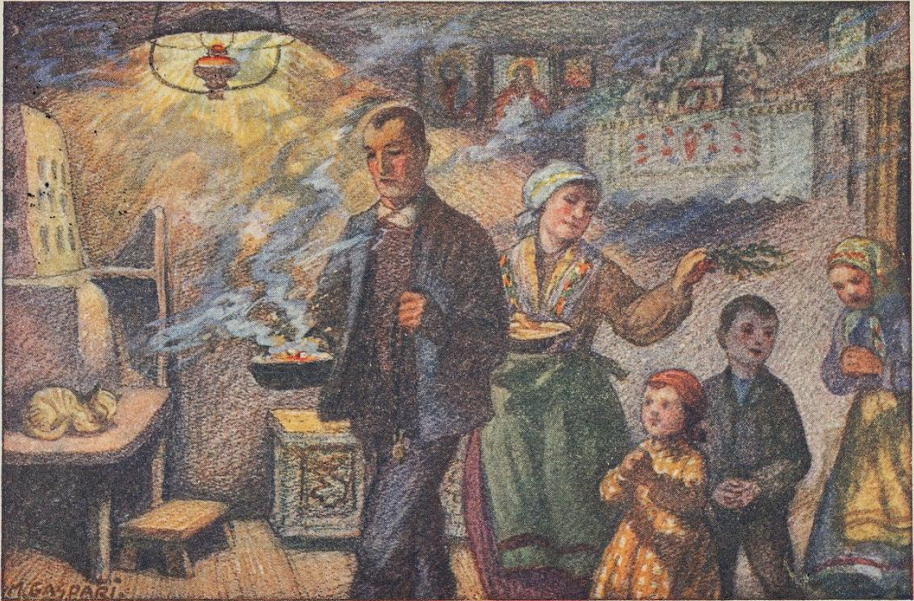
Vesele božične praznike!