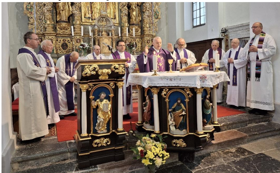
Duhovniki leskovške dekanije zbrani na Bučki, november 2024 z dekanom

Duhovnikov nas je vedno manj in kmalu bo veliko župnij ostalo brez duhovnika. Vedno manj je duhovnih poklicev. Seveda se vsi sprašujemo zakaj je to tako. Pomanjkanje vere spada prav gotovo med te vzroke, potem je tukaj medijsko linčanje duhovnikov, ki so s strani javnega mnenja prikazani kot neke pošasti in seveda tudi pomanjkanje velikodušnosti pri mladih ljudeh.