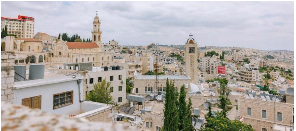
Mesto Betlehem danes

Zjutraj sem zgodaj vstal. Na cesti je bila snežna brozga. Prav tisti dan se mi je prelomilo stopalo na čevlju in snežna brozga je namočila notranjost mojih čevljev. Pohitel sem v baziliko Jezusovega rojstva. Vedel sem, da jo zgodaj odprejo. Pohitel sem po stopnicah k votlini in pravoslavni menihi so molili jutranjo molitev. Mislil sem, da se bom lahko potopil v molitev. Ko so zaslutili, da sem katoliški duhovnik, so mi dali takoj vedeti, da nisem zaželen in s prstom pokazali naj odidem. Tudi to je resničnost tega svetega kraja. Molitev sem nadaljeval v bližini votline.